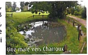
Une mare vers Charroux